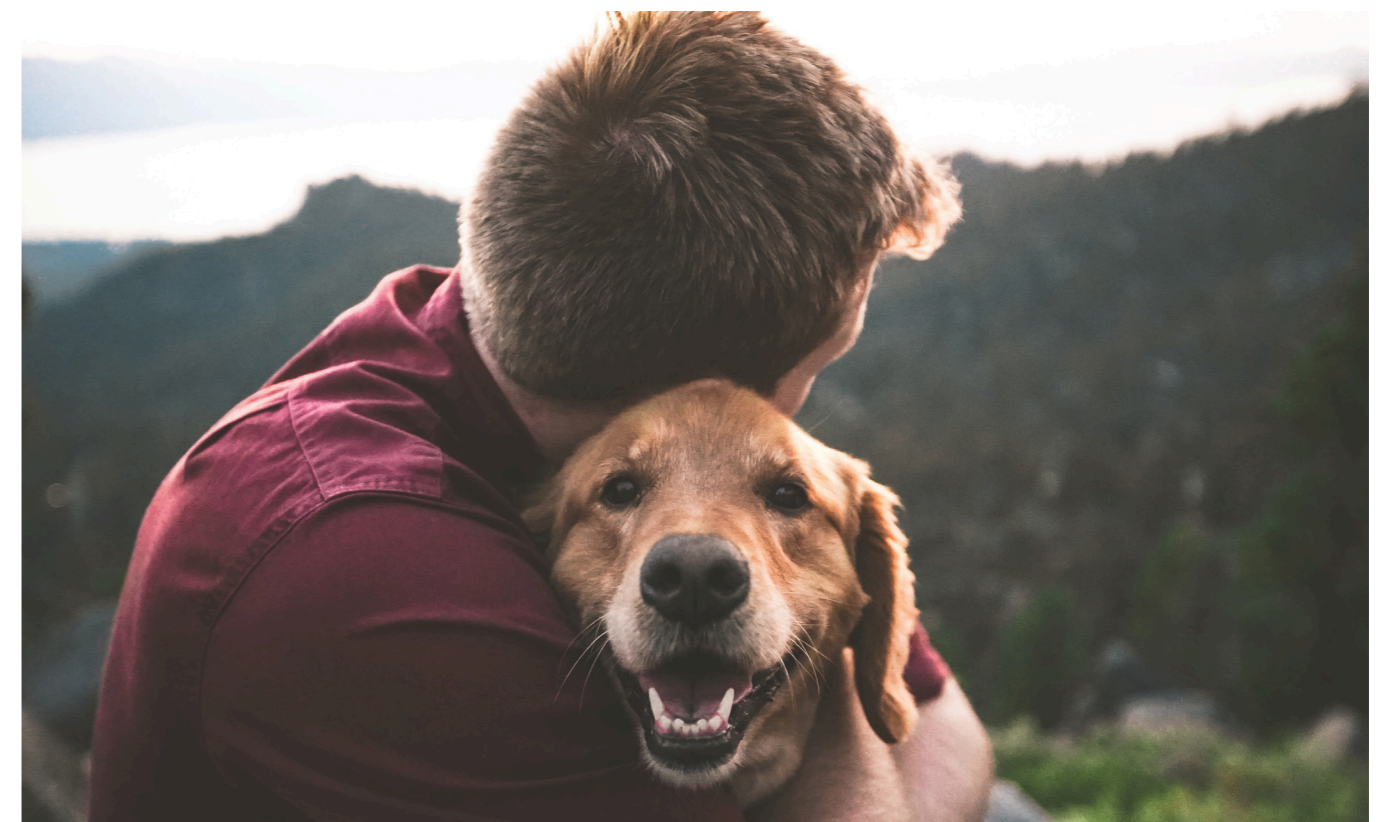
AT LA VOLOREST, AS EOSMITO

'IK GENIET VAN ZOWEL DE STAD ALS DE NATUUR. HET VOOR EVEN ANONIEM ZIJN IN DE MASSA VERSUS HET VOELEN VAN DE RUST EN DE ONEINDIGHEID.