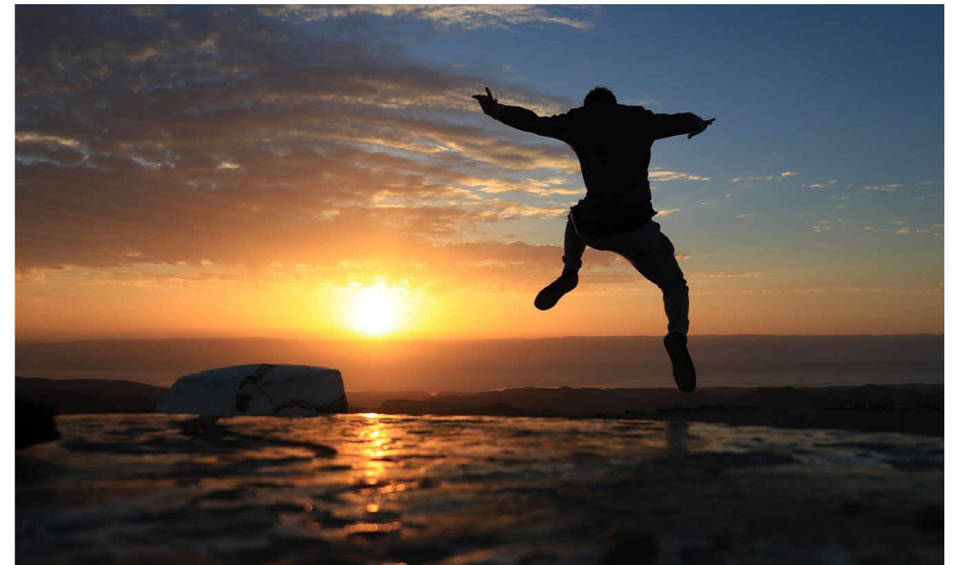
AT LA VOLEREST, AS EOSMITO

'MENSEN VRAGEN WELEENS OF IK GELUKKIG BEN. JA, IK DENK HET WEL ... AL BLIJVEN SOMMIGE DINGEN PIJN DOEN.'