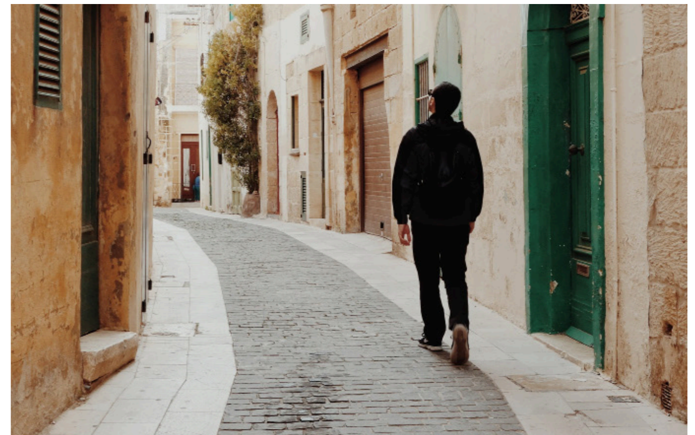
AT LA VLOREST, AS EOSMITO

Idem ea ad ma que cullandis enis magnihi llorum quae ma comnim imin posame voluptatem veliquo stiusam qui nonsedi cimus, nos