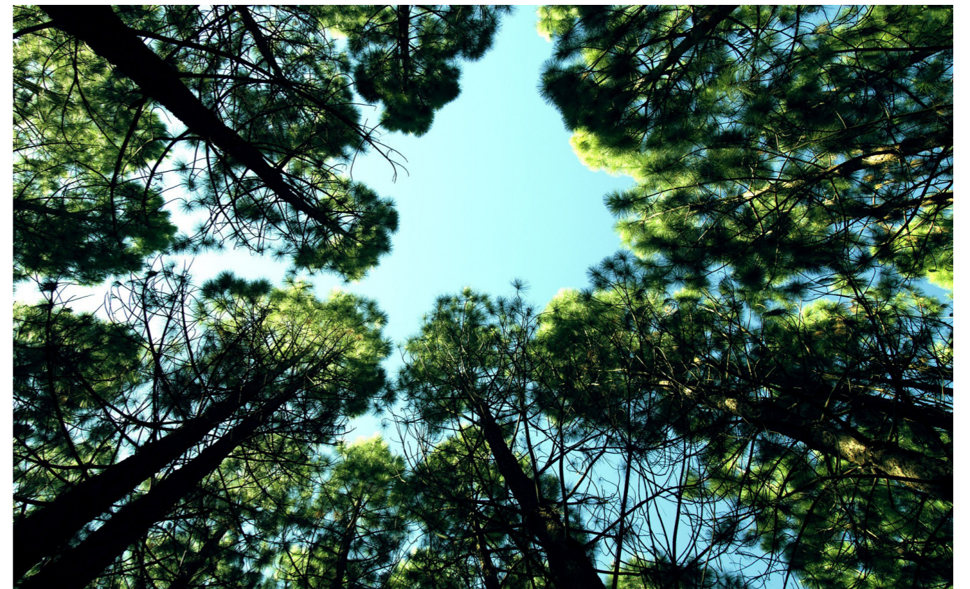
VOLE MA VEL ISCUM REPE CUM QUE VENT EM EXPERNA